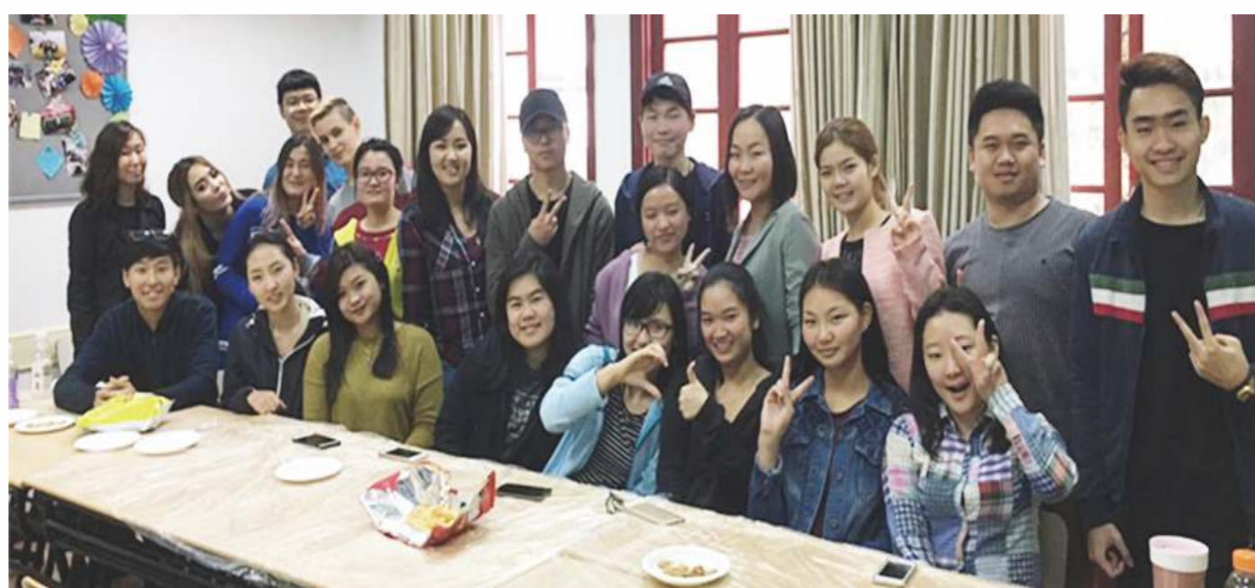
孔子學院獎學金於09年設立，至2014年資助來自150個國家25,000人來華學習。

孔子是中國傳統文化的代表，是四百多年前傳教士把《論語》譯成拉丁文開始的。而今，孔子學說已走向五大洲，各國孔子學院的建立，是孔子「四海之內皆兄弟」思想的實踐。「和而不同」以及「君子以文會友，以友輔仁」思想的實踐。不列顛哥倫比亞大學中文教授、加拿大中文協會會長陳山木先生是計畫的最早倡議者。