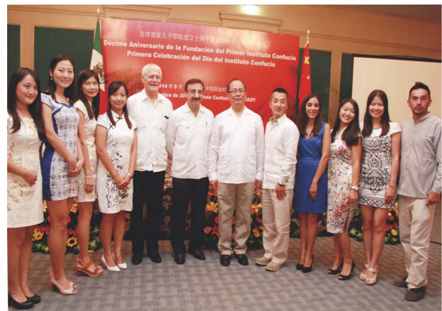
孔子學院是國家對外漢語教學領導小組辦公室在世界各地所設立。