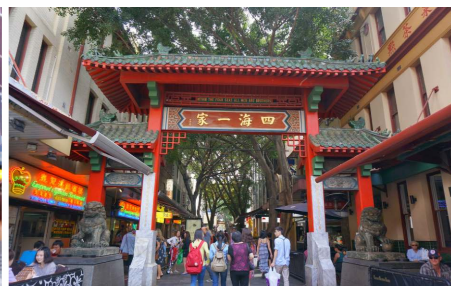
唐人街又稱華埠或中國城，是指華人在其他國家城市聚居的地區。