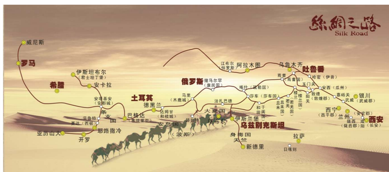
絲綢之路不是一條「路」，而是一個連接亞非歐的古代商業貿易路線。

絲綢之路今起中國西安(古長安)，經阿富汗、伊朗、伊拉克、敘利亞等地而達地中海，以羅馬為終點，全長6440公里，是古代絲綢貿易之路，也是連結亞歐大陸的東西文明紐帶。2014年中、哈、吉三國將陸上絲綢之路的東段「絲綢之路：長安-天山廊道的路網」成功申報為世界文化遺產，成為首宗跨國合作而成功申遺的項目。