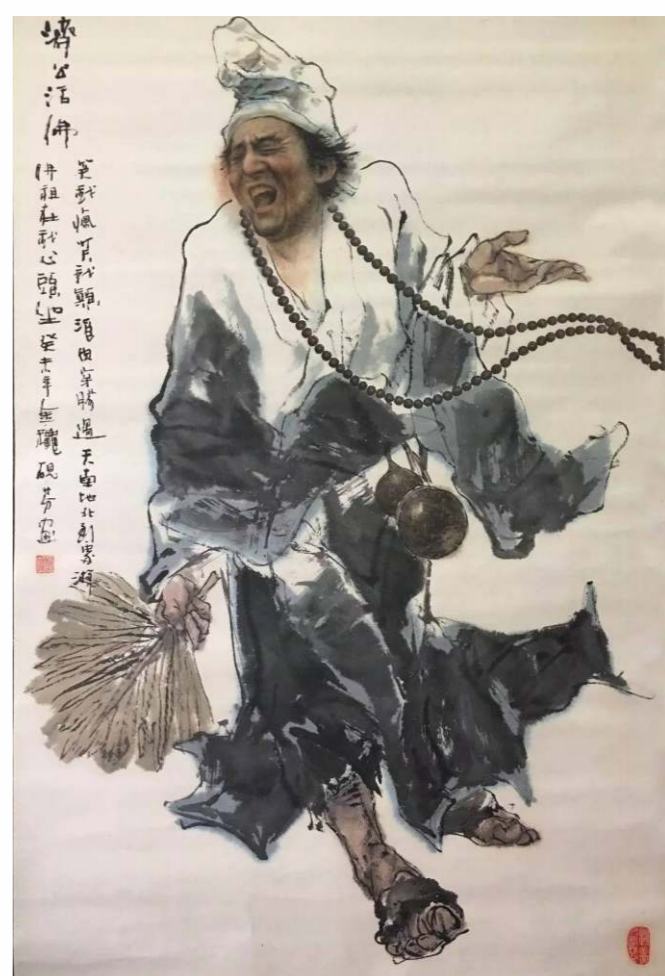
濟公傳說於2006年被列入國家首批非物質文化遺產名錄。

當代港台和內地有不少與濟公相關的電影和電視劇。在天台濟公故居門前，有國家首任總理周恩來評說：「人民很喜歡濟公，他關心人，為不平的事抱不平。」可見濟公鋤強扶弱的風采得到歷代民眾稱頌。隨着華人移居海外，濟公文化傳播至東南亞、澳紐和北美，成為一個具中華傳統的國際性文化。為了聯繫全球濟公文化愛好者，國際濟公文化協會於2014年在澳門創辦，旨在國際社會傳播濟公文化，推廣「無我利他」的濟公精神。