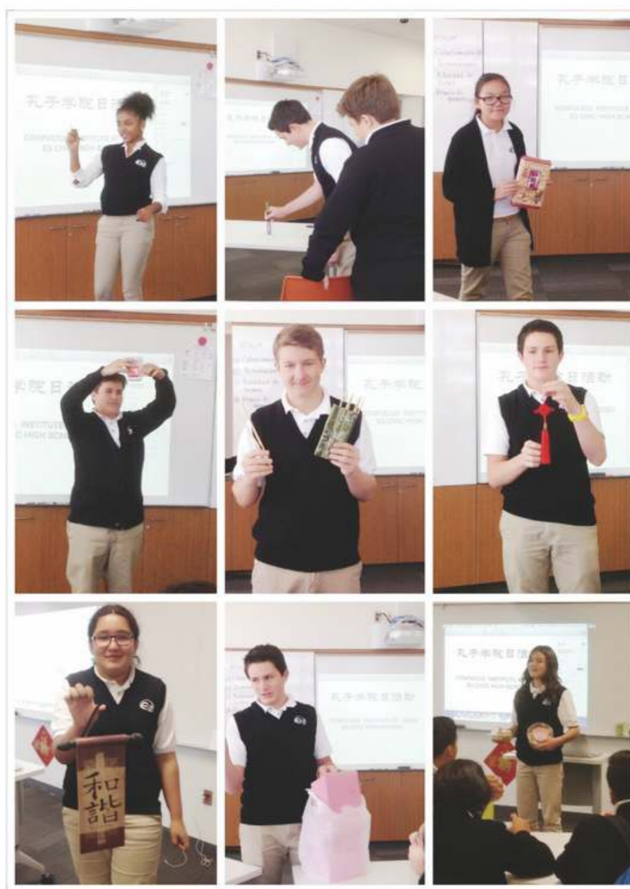
境外的孔子學院採用中外合作形式開辦，提供中國教育、文化和開展當代中國研究。

境外的孔子學院採用中外合作形式開辦，提供中國教育、文化和開展當代中國研究。美國於2012年5月審查孔子學院學術資質，要求部分教師離境，此舉引發輿論熱議。2014年9月美國芝加哥大學、賓夕法尼亞州立大學宣佈停止孔子學院合作；外交部當年12月就孔子學院是否限制美國大學學術自由作回應，發言人指海外孔子學院遵守所在國法律和法規，接受所在國政府監督。