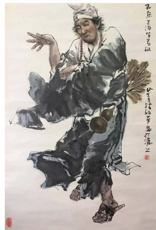
濟公傳說源於南宋，是以濟公為主人翁的口頭敘事，由方言文學編寫成為小說。