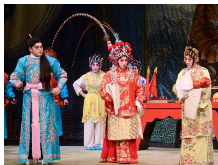
粵劇於2009年列入《人類非物質文化遺產代表作名錄》。