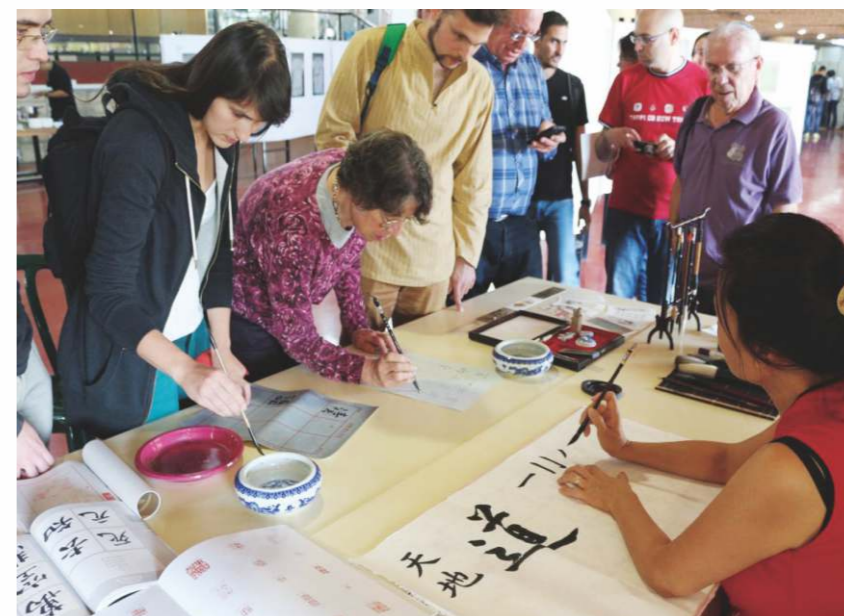
孔子學院為世界各地的漢語學習者提供正規及最主要的漢語教學管道。