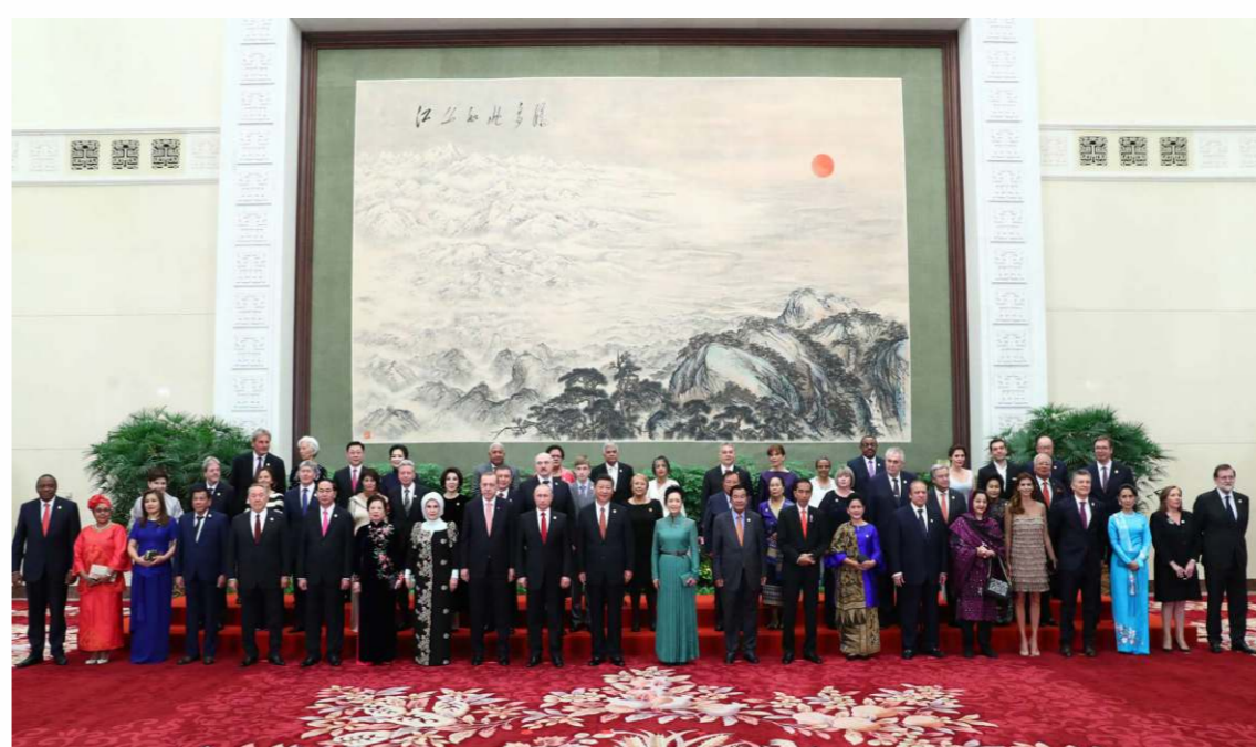
一帶一路高舉和平發展的旗幟，積極發展與沿線國家的經濟合作夥伴關係。

「一帶一路」貫穿歐亞大陸，東邊連接亞太經濟圈，西邊進入歐洲經濟圈，沿線有60多個國家，約44億人口。「一帶一路」是絲綢之路經濟帶和21世紀海上絲綢之路的簡稱，由國家主席習近平於2013年9月和10月分別提出的合作倡議。一帶一路旨在借用古代絲綢之路的符號，高舉和平發展的旗幟，積極發展與沿線國家的經濟合作夥伴關係，中國依靠與有關國家的雙多邊機制，借助行之有效的區域合作平臺，共同打造政治互信、經濟融合、文化包容的命運共同體。