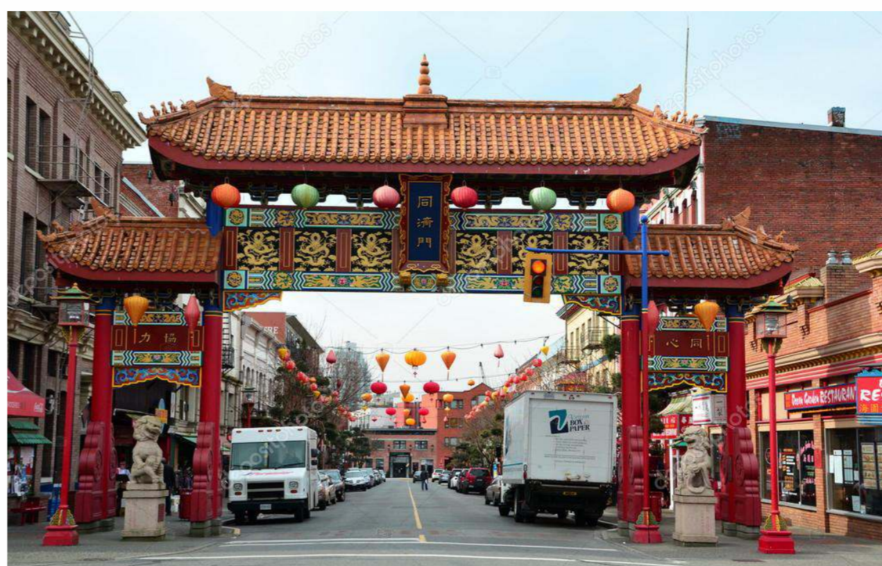
華人移居海外後，為了同舟共濟，群居在一起而形成唐人街。

唐人街又稱華埠或中國城，是指華人在其他國家城市聚居的地區。唐人街形成是因華人移居海外，成為當地的少數族群，在面對新環境需要同舟共濟，便群居在一個地帶，在東亞、東南亞、澳洲和北美洲皆常見。唐人街最早叫“大唐街”，始於唐代日本；當時日本人用以稱呼在日居留的中國人居住區。1875年，張德彝在《歐美環遊記》中稱唐人街為唐人城(Chinatown)。