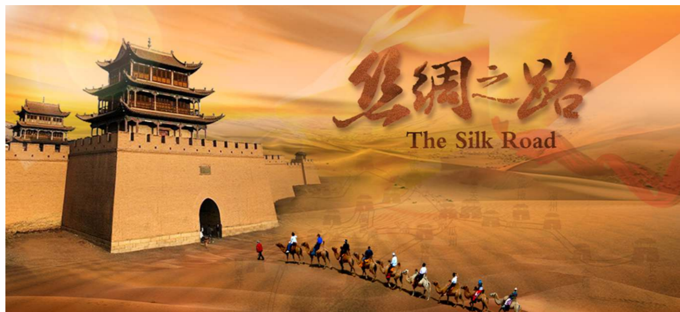
絲綢之路全長6440公里，是古代絲綢貿易之路，也是連結亞歐大陸的東西文明紐帶。