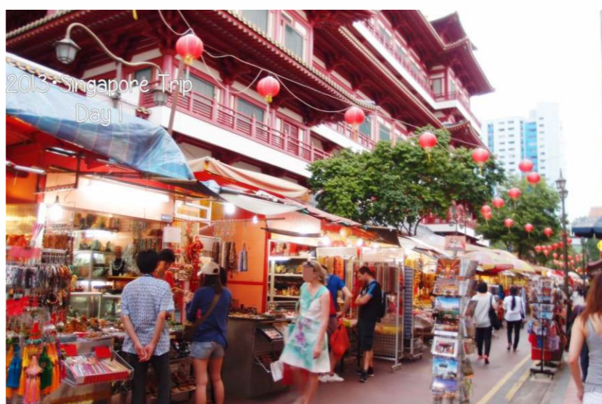
華人移民東南亞歷史較早，語言和文化多與當地融合。