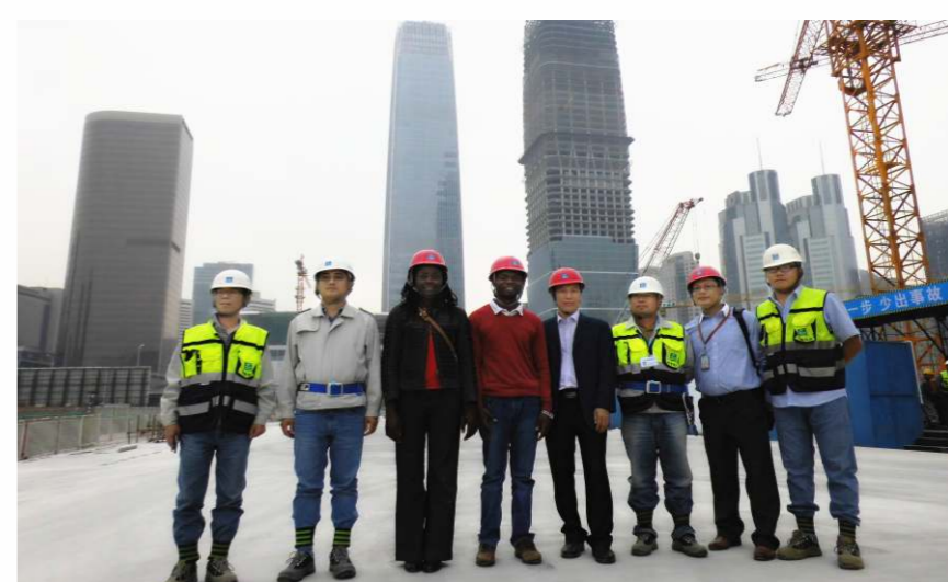
中國在「一帶一路」相關國家建設了75個境外經貿合作區，直接投資超600億美元。