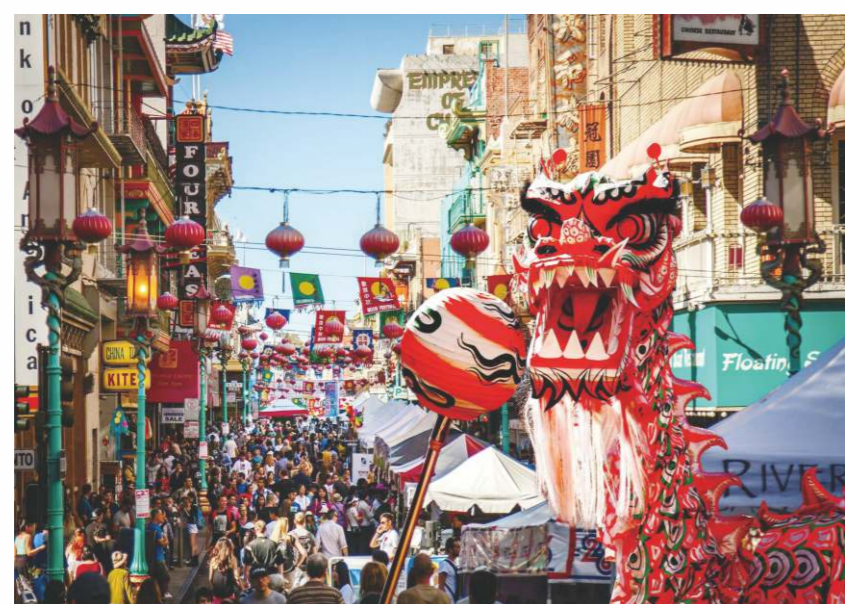
多地唐人街每逢春節均舞獅子迎新歲，保留著中國風俗。

不少唐人街後來成繁華街道，除了飲食業、刺繡、中國古玩店外，還有各類華人同鄉會、俱樂部、影劇院等，成了富有中華特色的街區；當地也有非華裔人光顧唐人街飯店，愛上這裡的中式飯菜。隨著有些華僑富裕，新一代華人會選擇其他地區居住，一些唐人街出現華人遷離人口老化；很多唐人街成了中華文化區的代名詞，華人聚居地的本意反而淡了。