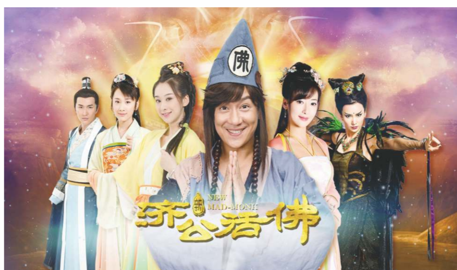
濟公鋤強扶弱的風采得到歷代民眾稱頌，更傳播至東南亞、澳紐和北美。