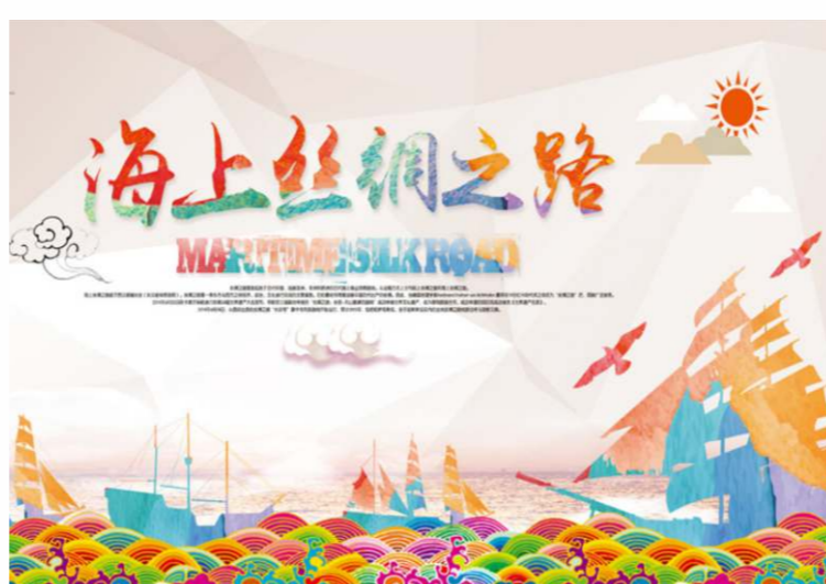
「一帶一路」是絲綢之路經濟帶和21世紀海上絲綢之路的簡稱。