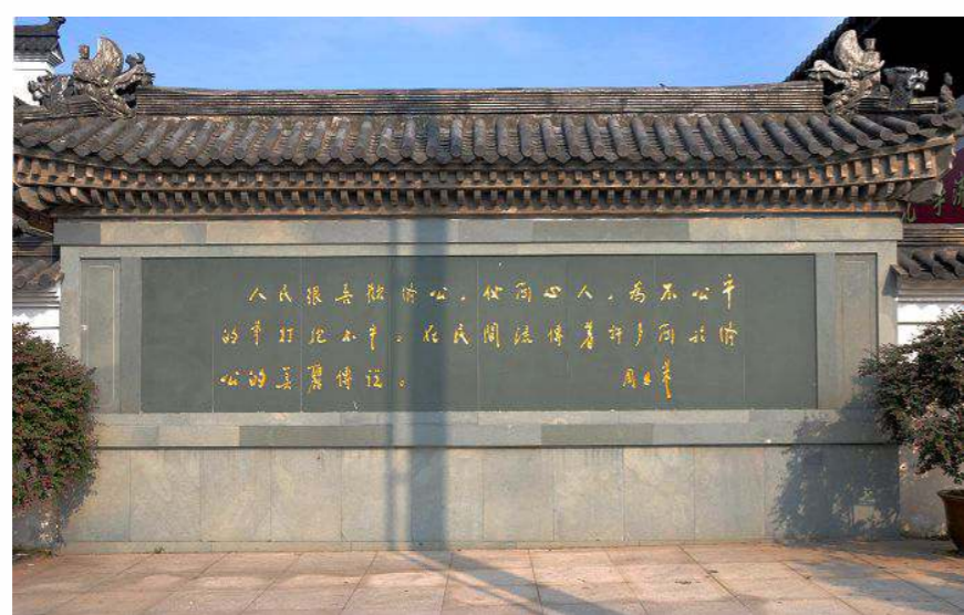
浙江天臺濟公故居門前，有周恩來總理的評述：「人民很喜歡濟公，他關心人，為不平的事抱不平。」