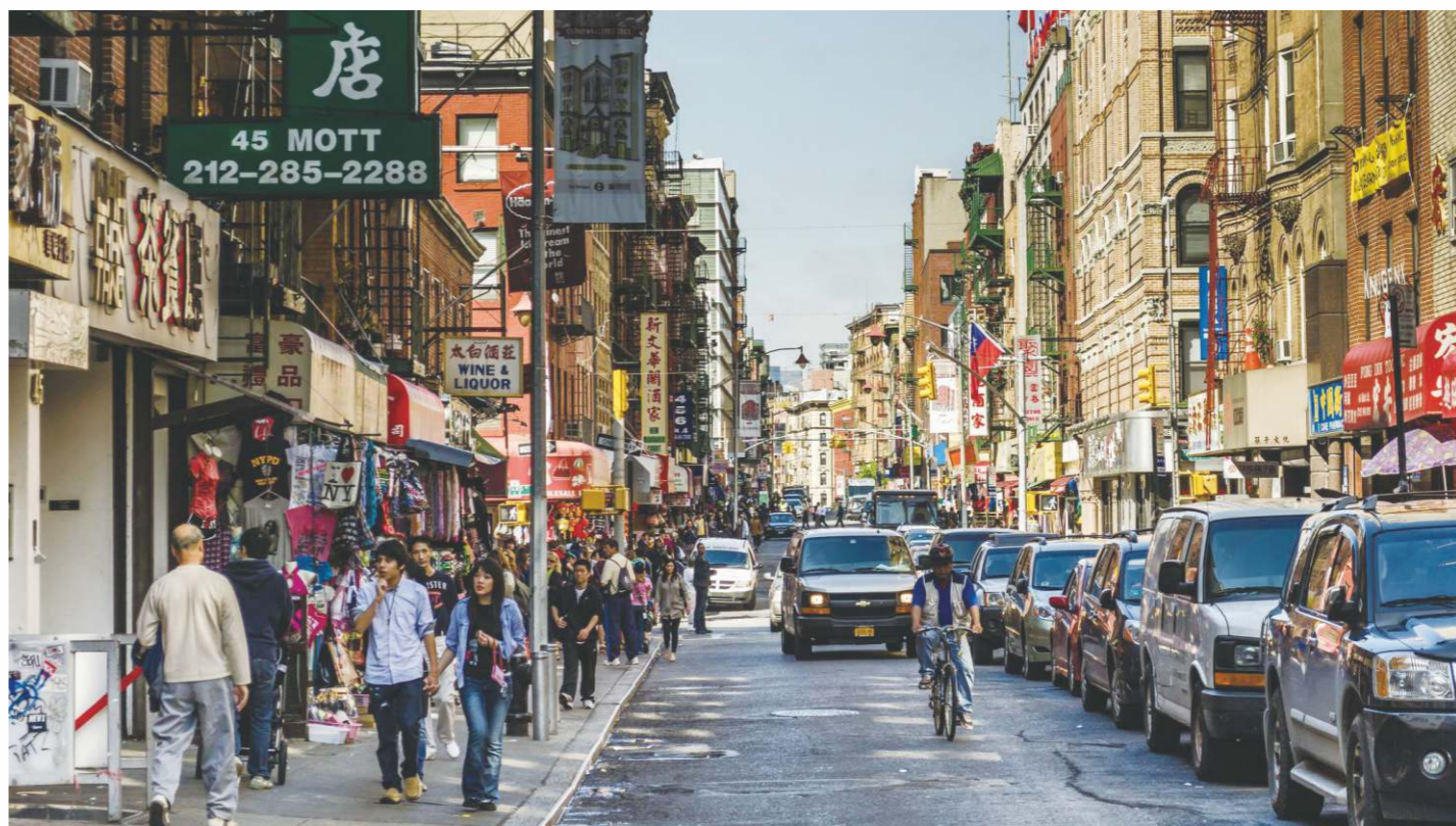
隨著有些華僑富裕，很多華人聚居唐人街的本意反而淡化了。

唐人街遍及全世界，將中華文化帶到世界各地。唐人街保持著中國的風俗習慣，講普通話或各省方言。唐人街有中國百貨店，有中文的書店、學校、報社、華人社團，也有中國式的廟宇、祠堂等。多地唐人街每逢春節均舞獅子迎新歲，保留著中國風俗。在外國人眼裡唐人街是“小中國”，延續中華傳統文化，也是各地華僑歷史的一種見証。