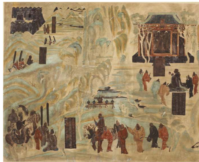
西漢張騫和東漢班超出使西域開闢的以長安和洛陽為起點，並連結地中海各國的陸上通道。