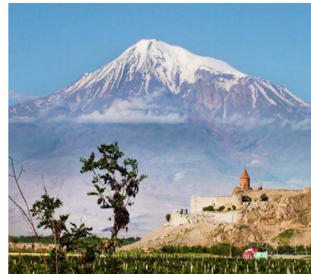
2014年「絲綢之路：長安-天山廊道的路網」成功申報為世界文化遺產。