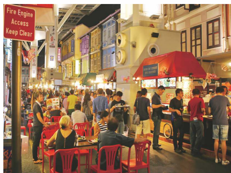
非華裔人士也愛光顧唐人街飯店，愛上這裡的中式飯菜。