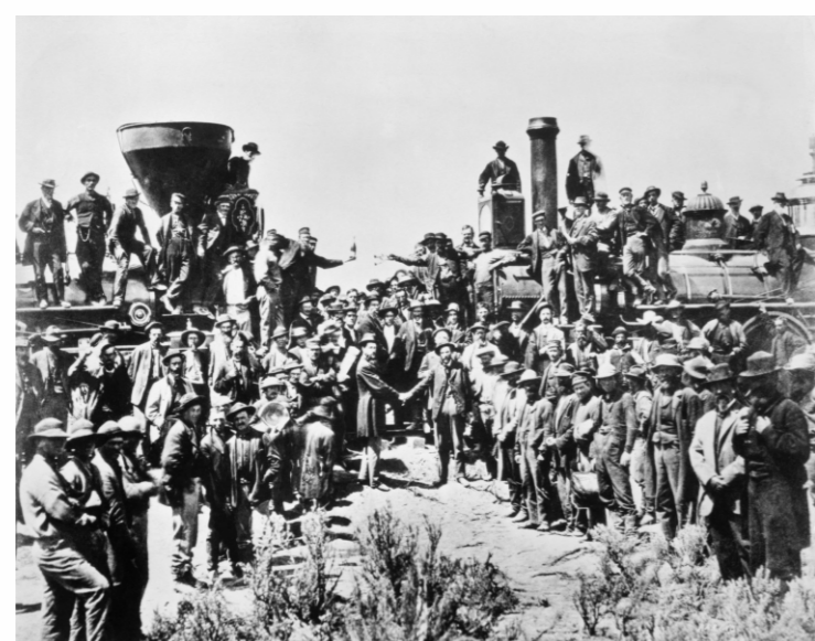
三藩市的“唐人街”由1850年前後開發美國西海岸的華工聚居而成。

三藩市的“唐人街”始於1850年前後，當年開發美國西海岸的華工初來異國，人生地疏，言語不通，便集中住在一起；當時開設的是方便華工的小茶館、小飯鋪，接著是豆腐坊、洗衣店等，並形成華工生活區。由於華人移民東南亞歷史較早，語言和文化多與當地融合，至今知名的唐人街相對較少有茨廠街和牛車水。在北美一些歷史悠久的唐人街，位於大城的舊區，環境會較為擠迫，治安和種族問題是某些華埠要面對的問題。