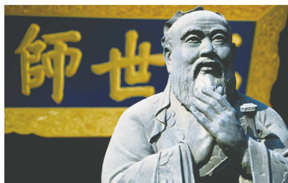
孔子是中國傳統文化的代表，是四百多年前傳教士把《論語》譯成拉丁文開始的。

孔子學院獎學金於2009年設立，至2014年底資助來自150個國家25,000人來華學習。《中國文化發展報告（2013）》顯示在2010年有1億外國人學習漢語，2013年學習漢語外國人達1.5億人。截至2017年12月10日，全球已有146個國家（地區）建立525所孔子學院和1113個中小學孔子課堂；其中「一帶一路」沿線有53國設立140所孔院和136個課堂，歐盟28國、中東歐16國實現全覆蓋，孔子學院成為漢語推廣和體現中國文化軟實力的品牌。