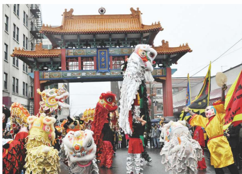
唐人街遍及全世界，將中華文化帶到世界各地。