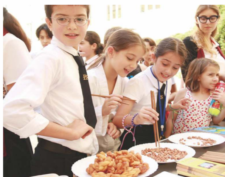
各國孔子學院的建立，是孔子「四海之內皆兄弟」思想的實踐。