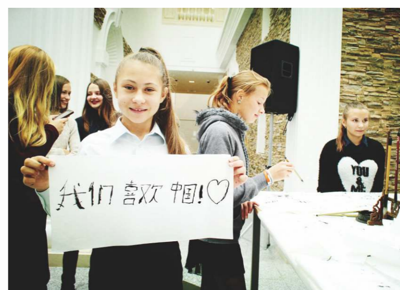
孔子學院成為漢語推廣和體現中國文化軟實力的品牌。