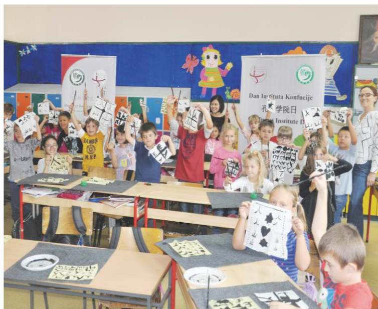
位於塞爾維亞貝爾格勒大學語言學院孔子學院慶祝“全球孔子學院日”。