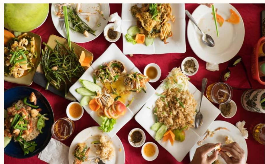
中國地區廣大，菜系繁多，從南向北的熱帶、副熱帶到溫寒帶，提供了多元的食材。

中國菜系之多是由於地區廣大，從南向北的熱帶、副熱帶一路到溫寒帶，由南海島嶼至大陸性氣候，還有世界屋脊的高原山脈與源遠流長的河流、窪地與湖泊，提供了多元的食材；加上持續幾千年的文化傳承與廚藝創新，使各地菜餚差異，並形成有一定知名度並為人們所喜愛的地方風味流派，稱作菜系。