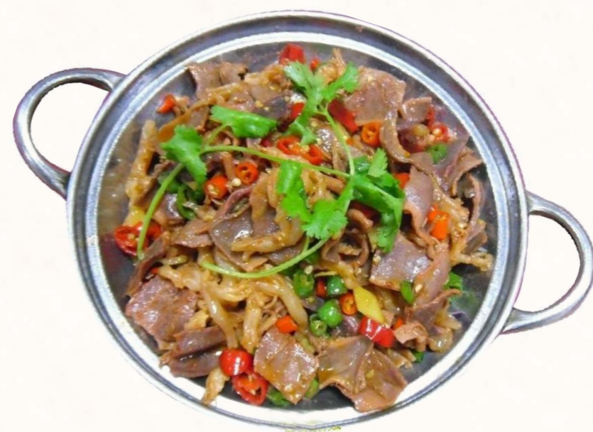
到唐宋時，中國南北飲食文化各自形成體系。