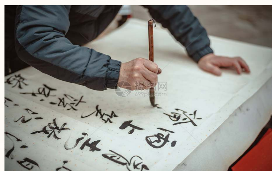
中華民族以漢族為主，漢族語言為漢語。