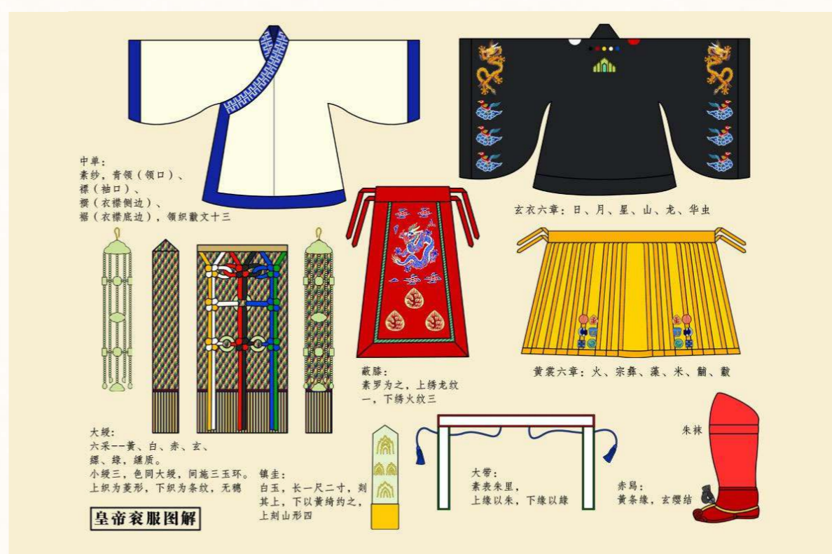
漢服特徵為交領右衽；無扣結縷；褒衣大袖。

穿漢服不僅是傳統服飾之美，亦體現追求天人合一的禮教文化。漢朝依據四書五經形成冠服體系，在宗法文化下，服飾具有昭名分、辨等威、別貴賤的作用，亦為吉禮、凶禮、賓禮、軍禮、嘉禮的禮服；普通漢人的家禮包括冠婚喪祭四禮時也穿漢服。由於華夏儒家文化的傳播，漢服影響周邊國家如日本、朝鮮、越南、蒙古、不丹等服飾，均仿效華夏禮儀制度及借鑒漢服特徵用於吉凶賓軍嘉五禮。