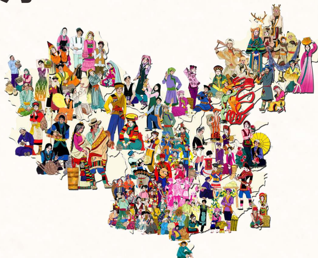
中國有53個少數民族都保有自己的語言。

中華民族以漢族為主，漢族語言為漢語，屬漢藏語系，是世界歷史悠久的語言；按學術界漢語分類有：普通話、粵語、吳語、閩語、湘語、贛語、客家話等七大方言。漢語含書面語以及口語兩部分，古代書面漢語叫文言文，現代書面漢語指使用標準漢語語法通行的文體。漢語是單音節語言，有音樂性和節奏感，亦使中國文章有可誦讀性。目前全球有六分之一人口使用漢語作為母語。