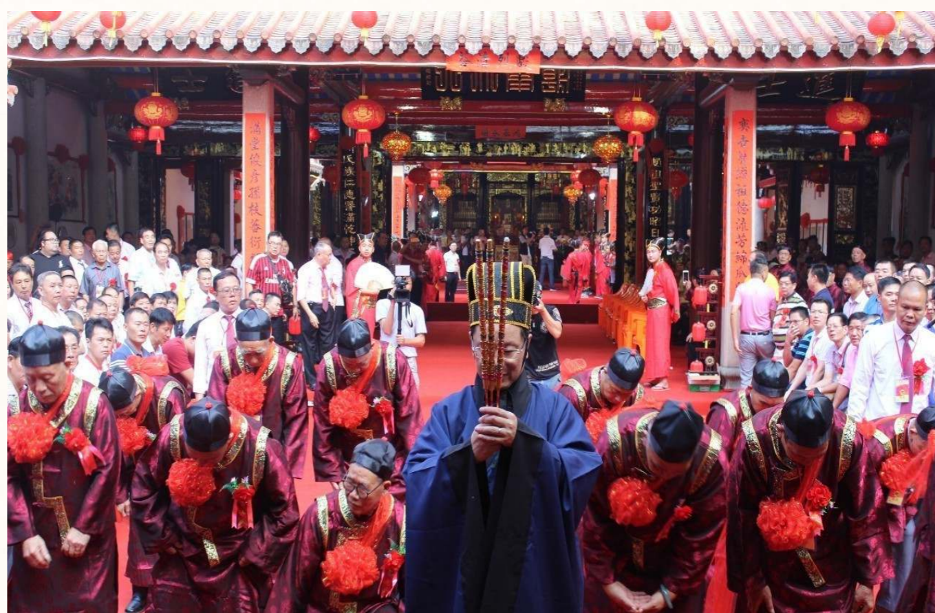
宗法傳統的信仰使古代民眾心靈上得到祖先的保佑。

《禮記·祭統》有「祭者教之本也」的說法，祭天祭祖就是古代民眾報本答恩的方式。敬天必忠君，於是忠道得以申張；法祖則重喪祭，孝道得以宏揚。宗法傳統的信仰使古代民眾心靈上得到祖先的保佑，同時也是培養民眾恭敬孝順之心。為了祈求豐年，古代民眾對土地和穀物的崇拜成為祭祀的核心，社稷之祭僅次於祭天，幾與祭祖相等；是因為民以食為天，收成的好壞直接影響到社會的發展。