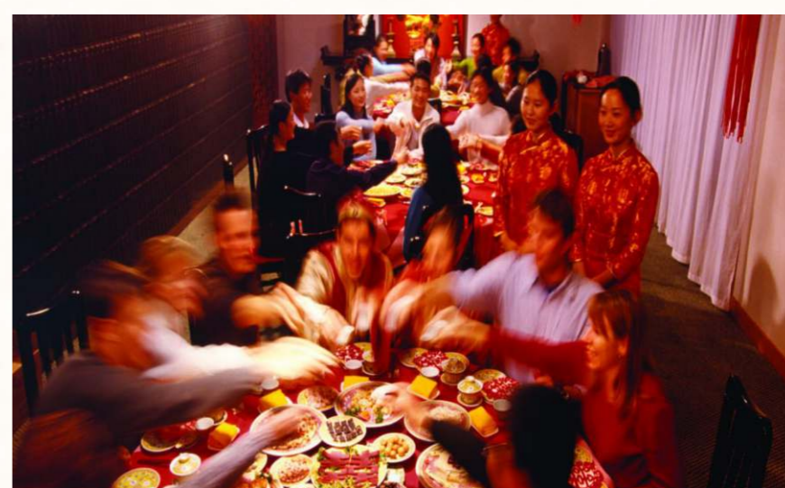
中國菜的特點為：色、香、味、意、形，被稱為國菜五品。