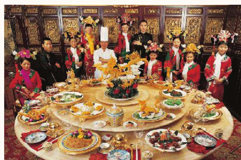
發展到清初，魯菜、蘇菜、粵菜、川菜成為最有影響的四大菜系。