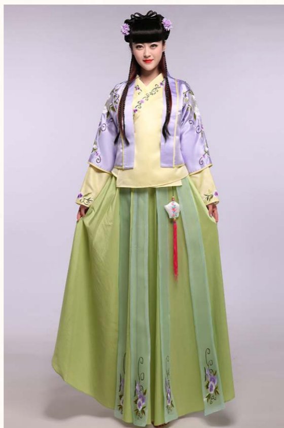
漢服是從黃帝即位到十七世紀中葉的漢族服飾。