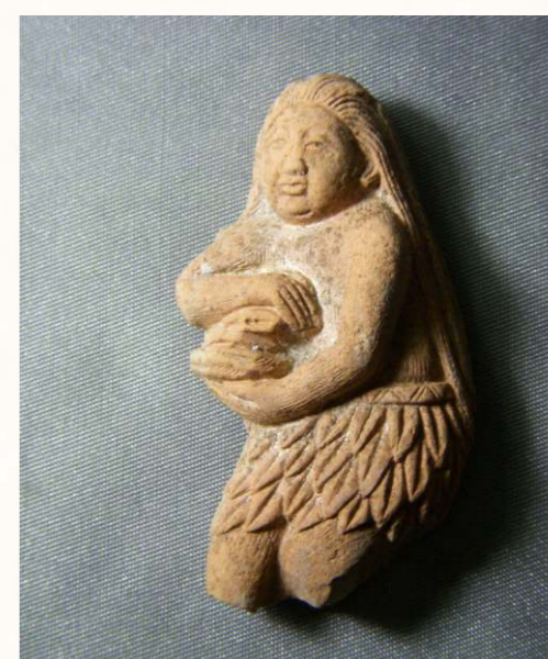
上古中國是母系社會，子女都跟母姓。