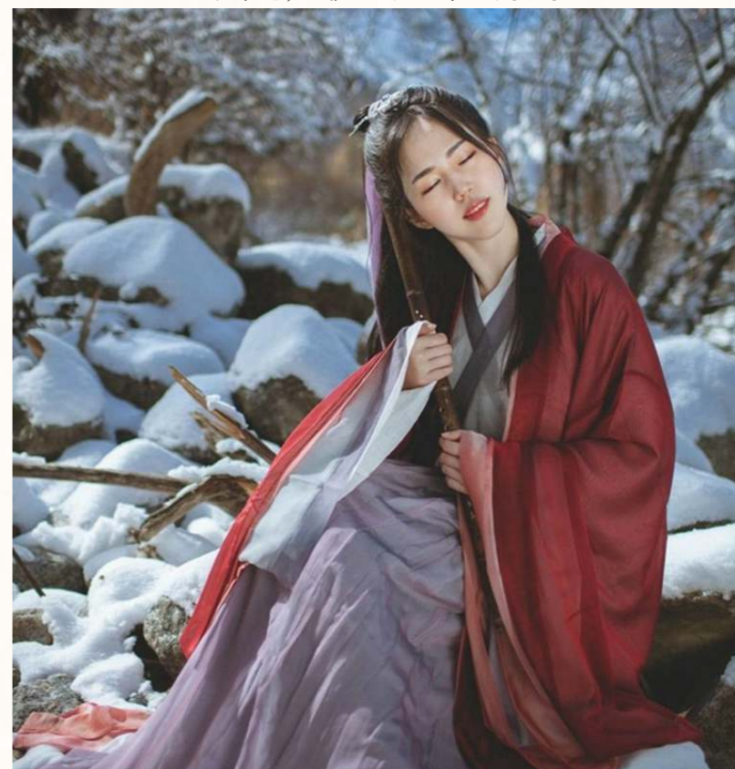
漢服承載染織繡工藝，傳承了30多項非物質文化。