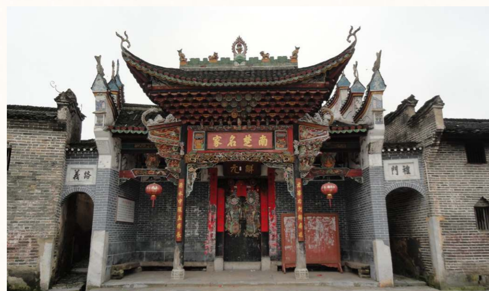
「同姓三分親」和「五百年前是一家」的俚語反映華人重視姓氏文化。