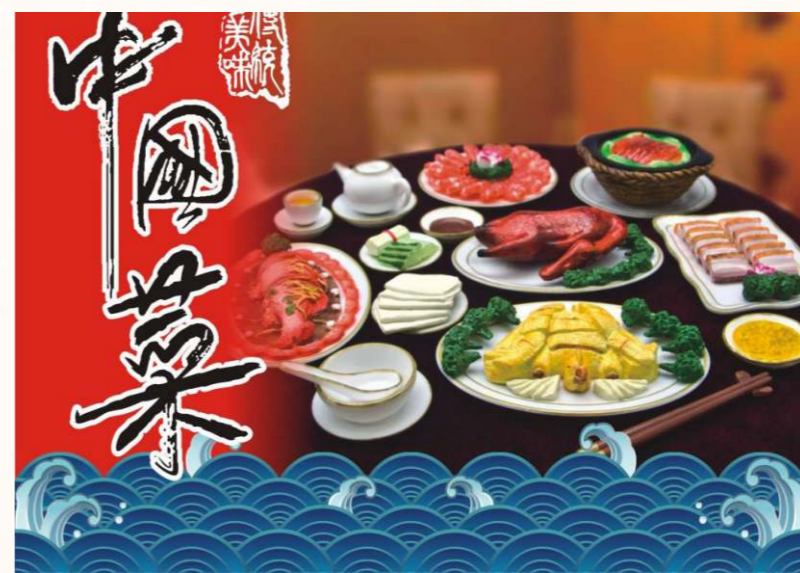
中國菜是中國傳統文化的組成部分，是世界三大料理之一。