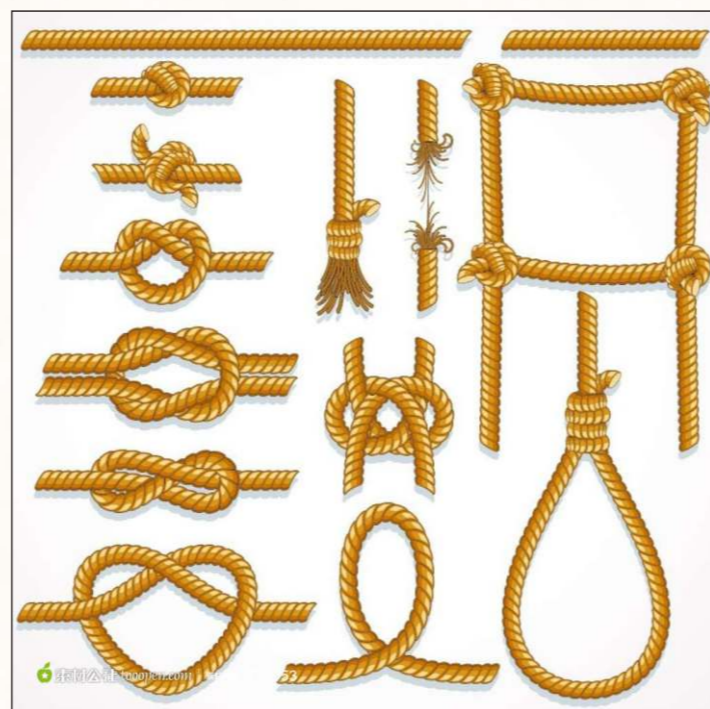
漢字起源由結繩記事開始