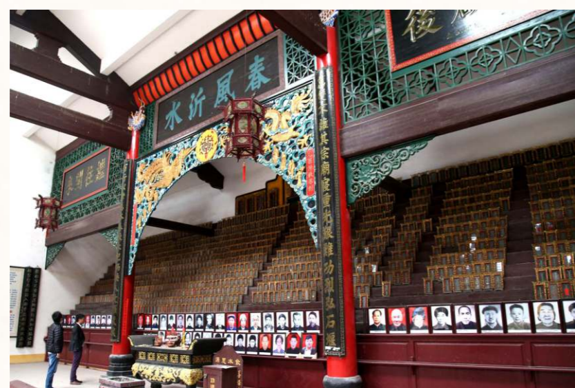
議事、禮典、懲罰違犯族規、解決族內糾紛等都在宗祠中舉行。

祖先崇拜發生自氏族社會，以父系血緣為脈絡的祖先崇拜強化祭祖文化。各地民眾的祭祀活動豐富，以宗祠或家廟為中心的祭祖文化，由於受宗法制度的影響，以血緣為紐帶的集體祭祖活動經久不衰；各地宗祠不單是處理信仰事務的場所，族中議事、集會、重大禮典、懲罰違犯族規、解決族內重大糾紛等活動都在宗祠中舉行。