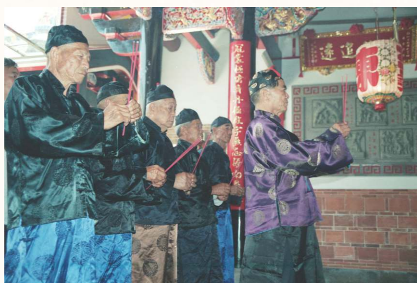
以父系血緣為脈絡的祖先崇拜強化了祭祖文化。