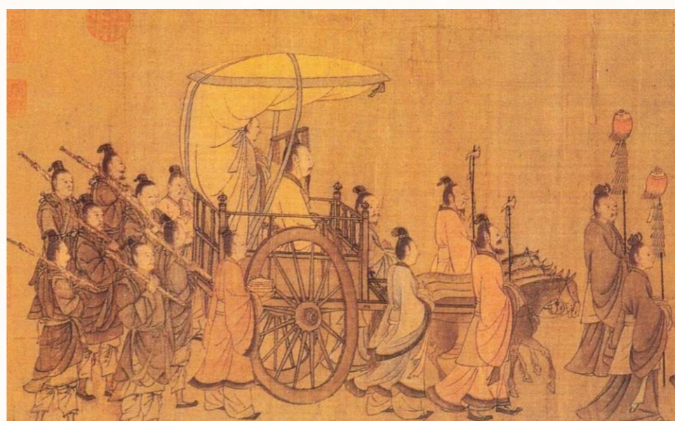
「氏」是姓的衍生，盛行於周代分封制度。