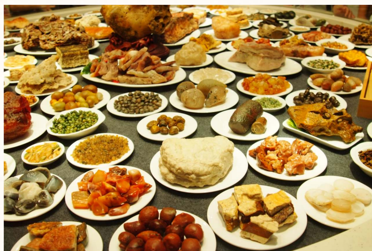
中國菜的特點為：色、香、味、意、形，被稱為國菜五品。

中國菜又叫中餐，源於中國，並對東亞地區和海外華人的飲食文化帶來影響，也是中國傳統文化的組成，是世界三大料理之一。中式餐飲文化歷史悠久，中國人發明了炒(爆、溜)、燒(燜、煨、燴、滷)、煎(湯、貼)、炸(烹)、煮(汆、燉、煲)、蒸、烤(醃、熏、風乾)、涼拌、淋等烹飪方式，又向其他民族學習了扒、涮等方式用來製作菜肴。中國菜的特點為：色、香、味、意、形，被稱為國菜五品。