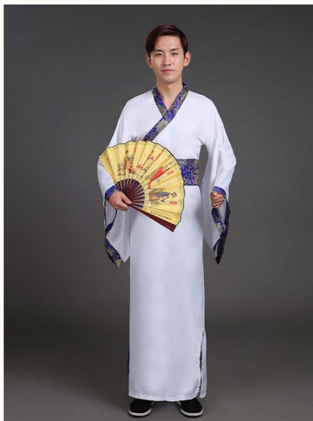
漢服璀璨多姿，中國因此被稱為「衣冠上國」、「禮儀之邦」。