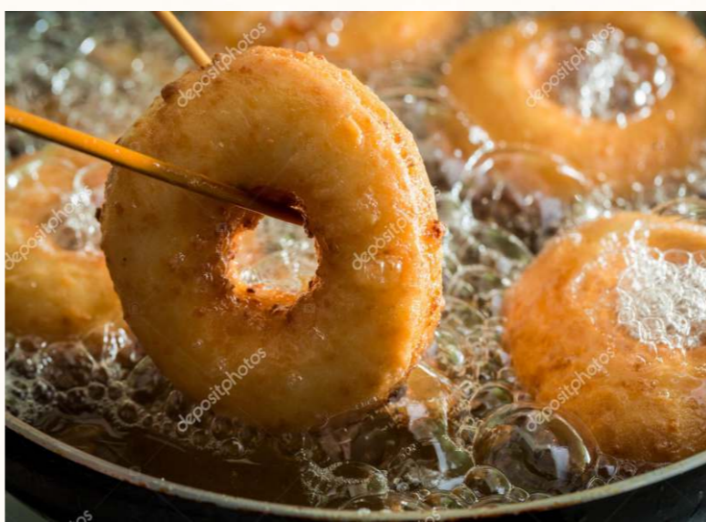
中國人發明了炒、燒、煎、炸、煮、蒸、烤、拌、淋、扒、涮等方式來製作菜肴等烹飪方式。