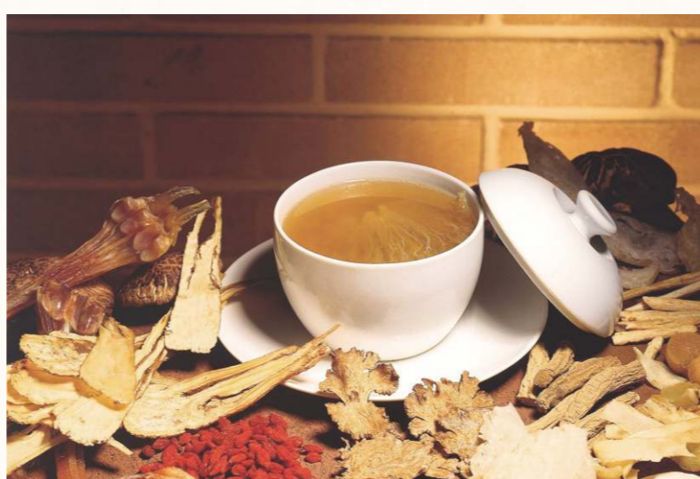
除影響較大的八大菜系外，還有藥膳及各地各有傳統特色烹飪技藝的菜系。