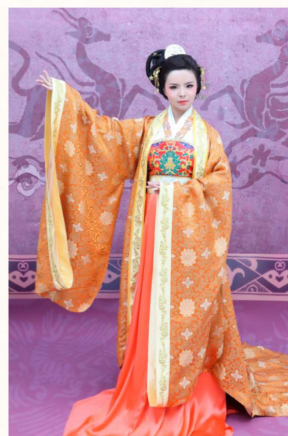
在宗法文化下，服飾具有昭名分、辨等威、別貴賤的作用。