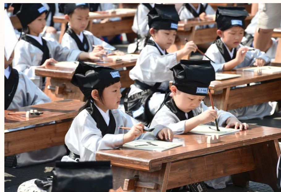
漢服蘊涵著中華傳統文化的內涵，受儒道墨法諸家哲學思想的影響。

以深衣為例，漢服必須符合「規、矩、繩、權衡」。深衣下擺用布帛共12幅，以應一年12月之意，體現法天思想。衣袖呈圓弧狀以應規，交領處成矩形以應方，代表做人要有規矩。衣帶下垂很長，一直到腳踝，代表正直。