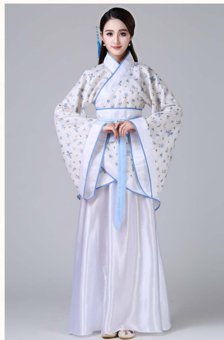
西周時期對衣冠禮制有規定，被納入禮制內。

西周時期周禮制度形成，對衣冠禮制有規定，冠服制度被歸入禮制內，成為禮儀文化的表現，漢服發展至此臻完善。