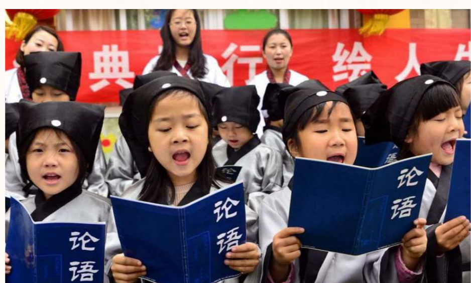
漢語是單音節語言，有音樂性和節奏感。