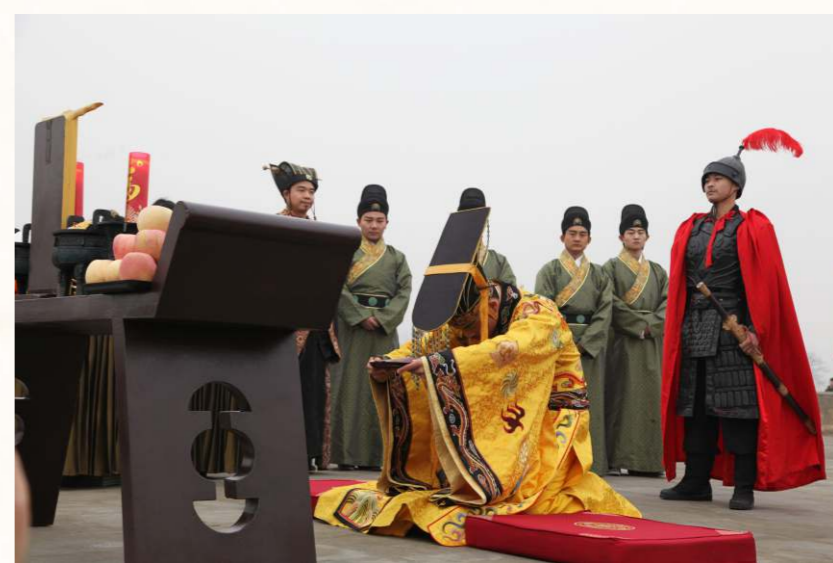
祭天祭祖就是古代民眾報本答恩的方式。