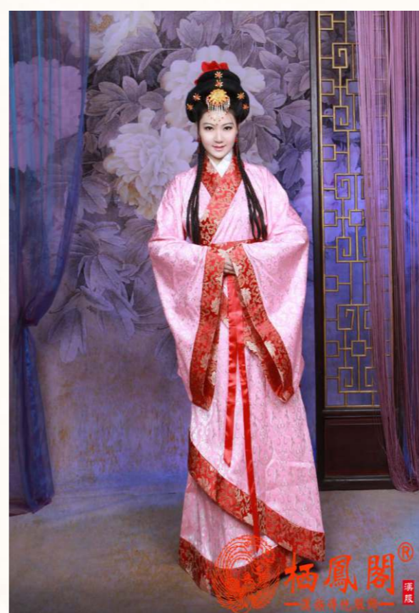
穿漢服不僅是傳統服飾之美，亦體現追求天人合一的禮教文化。

下襟與地面齊平，代表權衡。當人穿上漢服，自然就會注意言行舉止，由此可見漢服蘊涵著傳統文化的內涵，受儒道墨法諸家哲學思想的影響。