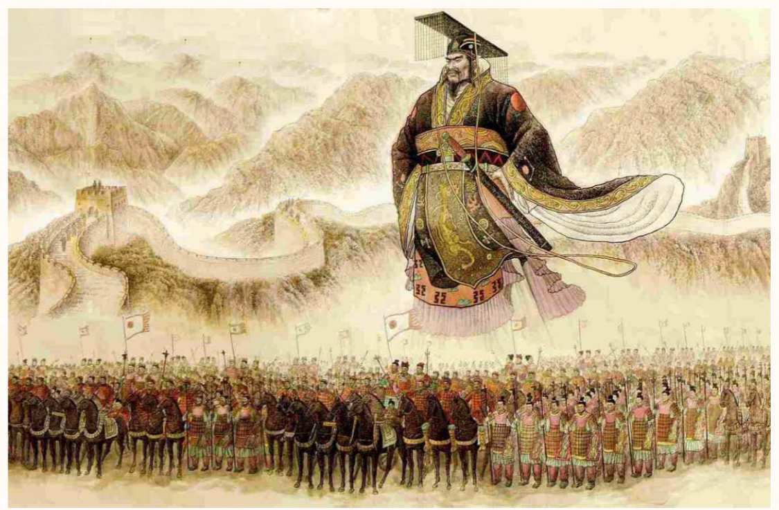
秦統一後，把小篆作為全國規範的文字，功不可沒。

史上只有漢字從沒間斷地演變過來，是現今世界上使用人數最多的文字，中華文化是用漢字建構的文明。漢字起源由結繩記事開始，黃帝記事官倉頡依據鳥獸和事物形狀創造象形符號，形成古漢字；經過幾千年演變，成為今天全球華人使用的繁簡體漢字。最早被發現的漢字是商周時期刻在龜甲和骨上的甲骨文；秦統一中國後，在大篆和六國古文基礎上制定出小篆，作為標準的書寫字體，統一了文字。