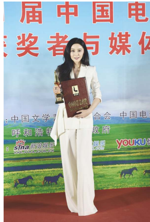
中國電影於2003年後保持30%的復合增長，速度在全球罕見。

國產片是2017年票房主力軍，376部國產片貢獻54%的票房。全年票房前五名有四部是國產片。觀眾