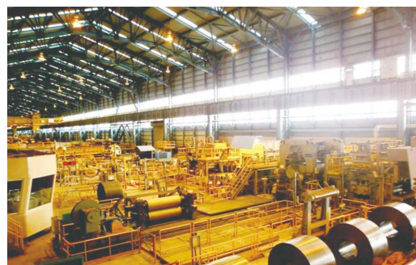
中國的高技術產業增加值、出口額等指標都超美國，佔世界首位。

中國在40年間發生翻天覆地的變化，全國城鎮化於2016年已達57.4%；40年改革開放的成功是選擇了有中國特色的社會主義道路。國家常在調研基礎上制定出中長期規劃，並通過真抓實幹使規劃變成現實。為表走共同富裕道路的初心，國家使7億人走出絕對貧困境地，並正花大力氣解決最後4000萬人口的脫貧問題，以全面建成小康社會為目標。