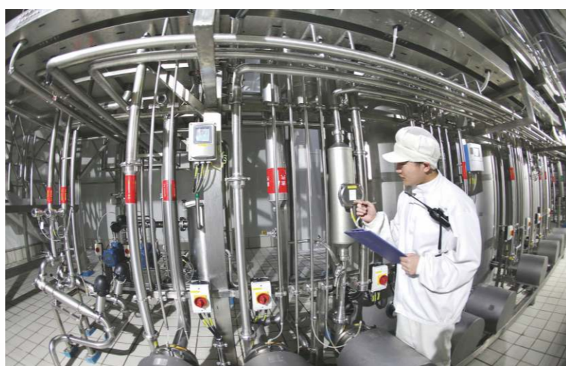
《2016年全球製造業競爭力指數》報告指中國製造業競爭力已居世界第一。