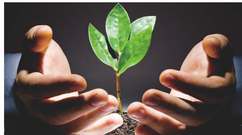
歐洲專利局數據顯示中國華為以2398件申請成為在歐專利最多的外國企業。

由美國國家科學基金會2018年發佈的《科學和工程指標報告》，中國科研成果在超美國學術界；中國於2016年發表被編入索引的學術論文有42.6萬份，佔國際總量18.6%，美國首次以40.9萬份論文量名列第二。中國科學院院長白春禮於今年兩會發表，中科院即將發布一款具有自主知識產權並達到國際領先水準的微處理器—MaPu代數處理器，這處理器問世後將在世界電腦、通信領域及消費電子市場大放異彩。