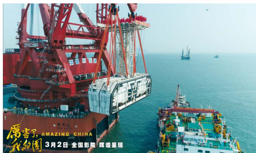
中國夢是國家富強、 民族振興、人民幸福。