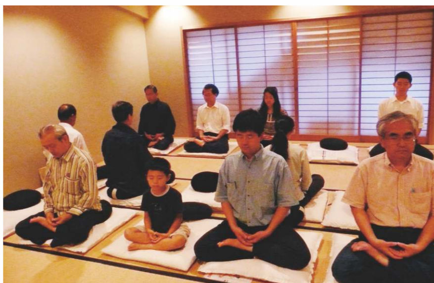
養生通過養精神、調飲食、練形體、慎房事、適寒溫等方法去實現。