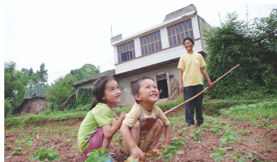
國家使7億人走出絕對貧困境地，以全面建成小康社會的目標。