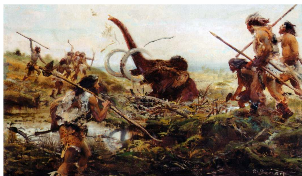
古代民眾通過狩獵野獸和參加戰鬥，獲得格鬥和搏殺的技能。