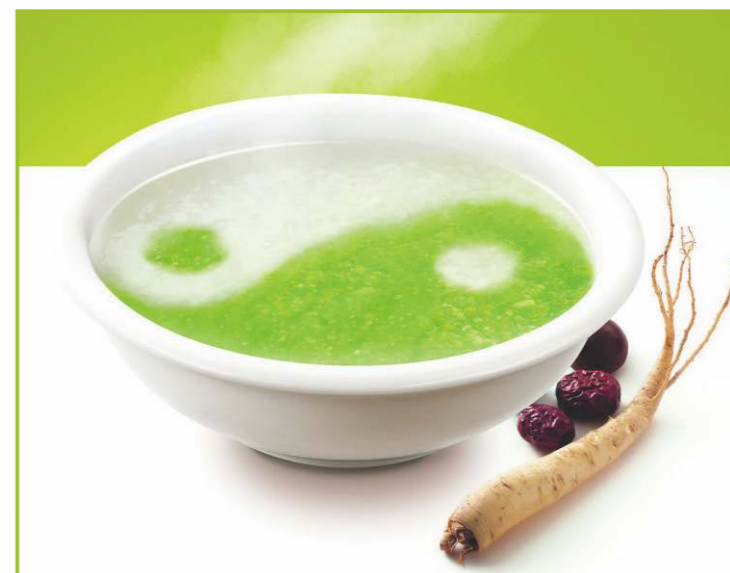
養生原指通過各種方法頤養生命、增強體質，從而達到延年益壽的活動。