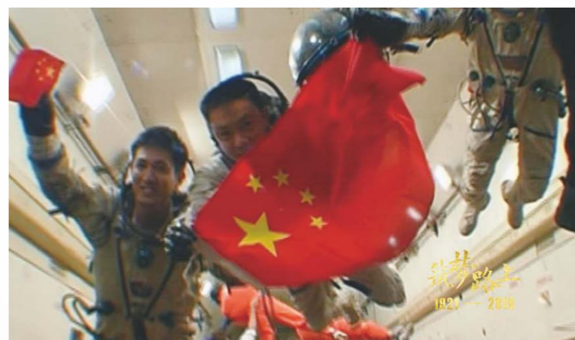
中國夢是建成富強民主文明 和諧的社會主義現代化國家。