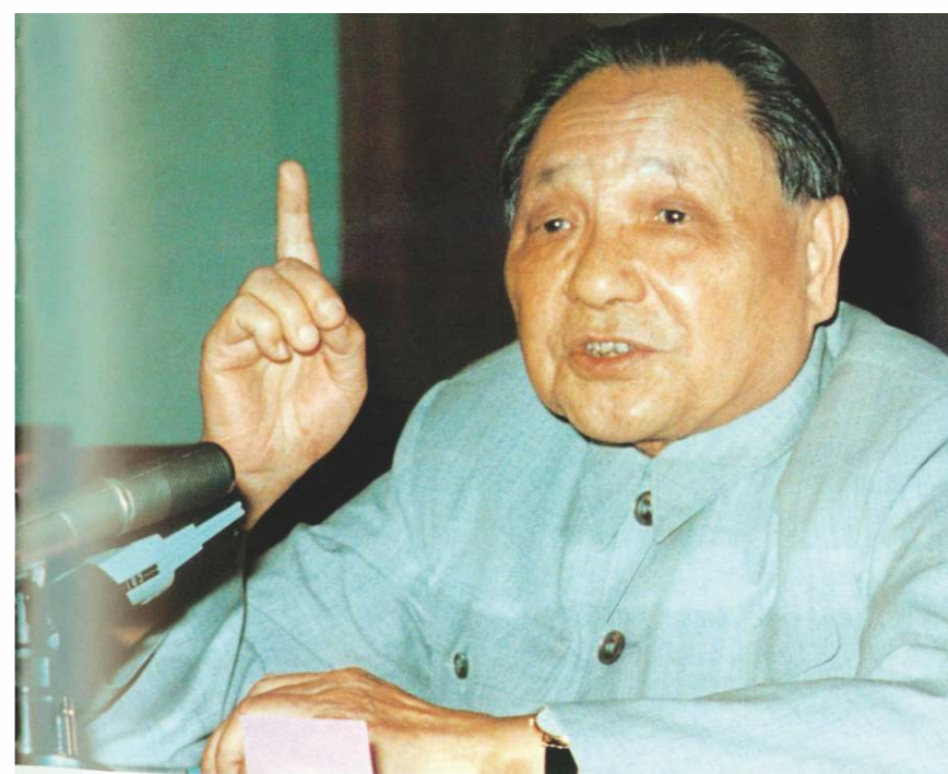
鄧小平於1978年確立的「對內改革、對外開放」戰略國策，成果卓著。

1976年底持續十年的文化大革命運動結束，那一年中國GDP為1539.4億美元，人均GDP僅165.4美元；農村人口佔82.6%，大部份是屬於絕對貧困的。中國共產黨於1978年召開十一屆三中全會提出把黨和國家工作重點從抓階級鬥爭轉到抓經濟，總設計師鄧小平確立了「對內改革、對外開放」的戰略國策。國家40年來始終堅持市場取向的改革，這是成果卓著的一個原因。