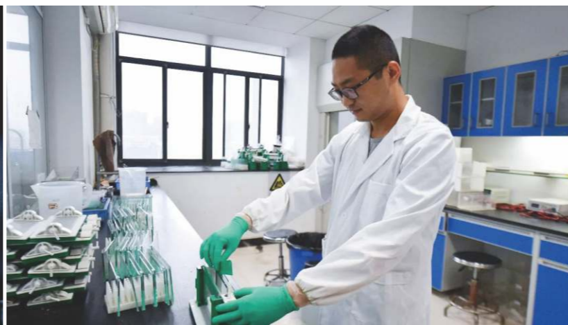
2016年世界知識產權統計顯示中國申請數連續6年居首位。