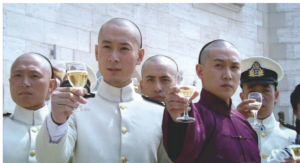
國產片是2017年票房主力軍，376部國產片貢獻54%的票房。