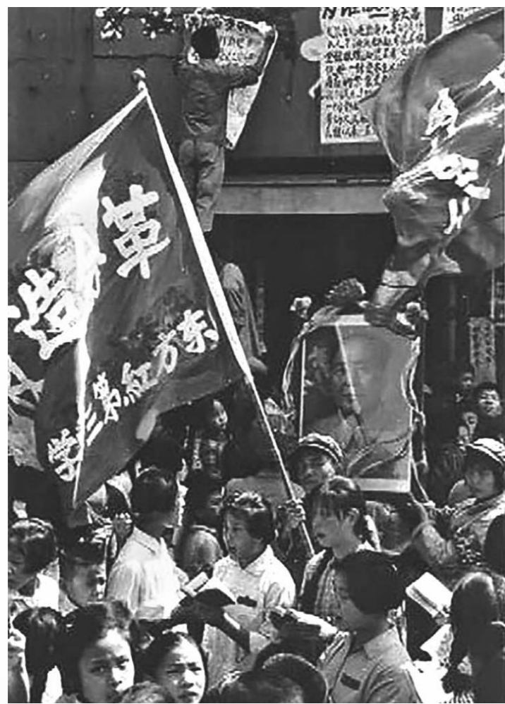
1976年底，持續十年的文化大革命運動結束，那一年中國人均GDP僅165.4美元。

中國開放經歷三大浪潮：第一個浪潮是上世紀80年代到90年代的開放，主要是引進境外投資，促進各地基礎建設和工業發展。第二個浪潮在2001年加入世界貿易組織後，