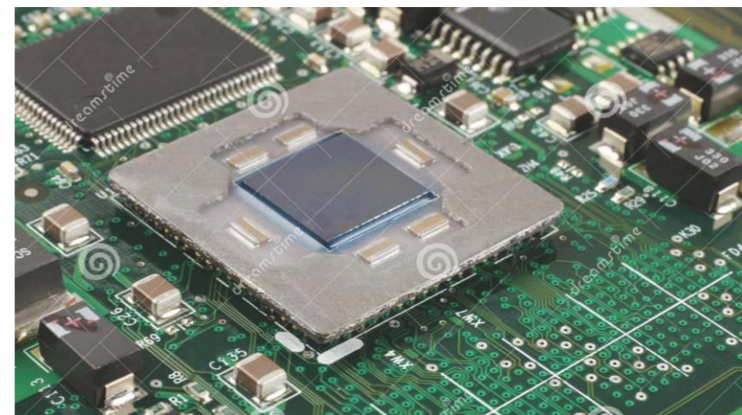
中科院即將發布一款MaPu代數處理器，將在世界電腦及電子市場大放異彩。