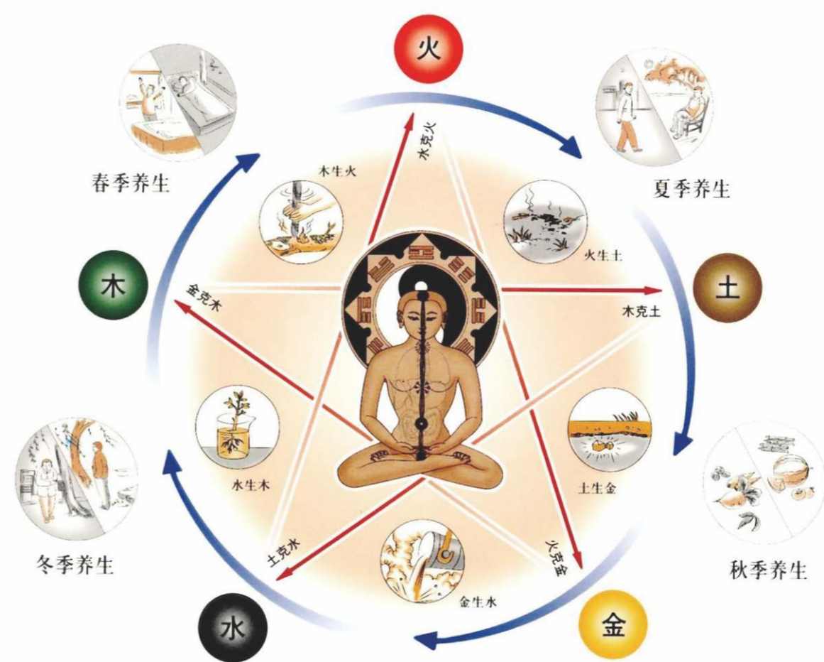
中醫養生不但注意身體的鍛煉保養，亦注意心靈的修煉調養。

養生通過養精神、調飲食、練形體、慎房事、適寒溫等方法去實現，是一種綜合性的強身益壽活動。中醫養生注重身心兩方面，不但注意有形身體的鍛煉保養，亦注意心靈的修煉調養，一體兩面缺一不可。養生保健則指保養、調養、頤養生命，即以調陰陽、和氣血、保精神為原則，運用調神、導引吐納、四時調攝、食養、藥養、節欲、辟穀等養生方法，以達到個人的健康長壽。