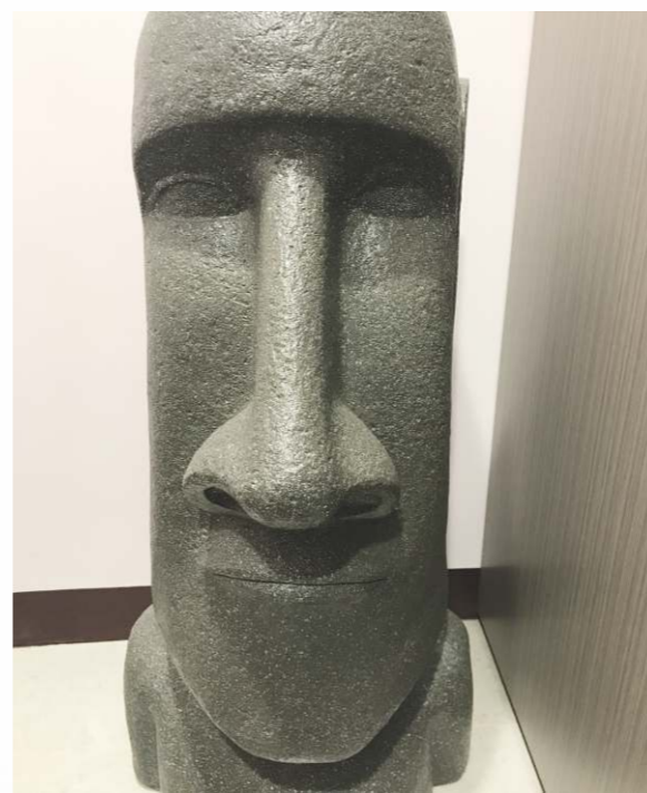
文化創意產品把無形資本轉化為有形幣值，帶來直接和間接經濟增長和就業。