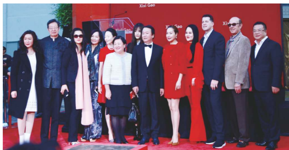
《中華人民共和國電影產業促進法》將電影業納入國民經濟與社會發展規劃。

年均觀影1次多，低於世界最高的4次，培養觀眾觀影消費是未來努力的方向。2018年春節中國電影票房以57.23億刷新紀錄。中國電影產業有較大規模，但同好萊塢電影工業相比，在劇本創作、觀念創新、人才儲備以及市場規範等還有差距。中國電影未來發展需建構既滿足國內觀眾需求又能為全球觀眾帶來價值的共用性電影，並要適應全球市場的傳播體系。