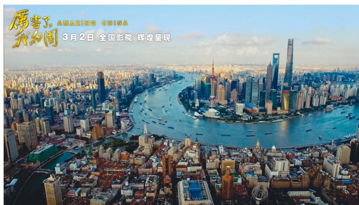
中國夢是民族復興的構想： 到2021年時國家全面建成小康社會。

中國夢是中華民族的夢，也是每個中國人的夢。中國夢是習近平總書記於2012年上任時提出實現民族復興的構想，核心為兩個一百年目標：到中共成立100周年的2021年時國家全面建成小康社會和2049年中華人民共和國成立100周年時建成富強民主文明和諧的社會主義現代化國家，具體表現是國家富強、民族振興、人民幸福；實現方法是走中國特色的社會主義道路、弘揚民族精神，實施政治、經濟、文化、社會、生態文明五位一體的建設。