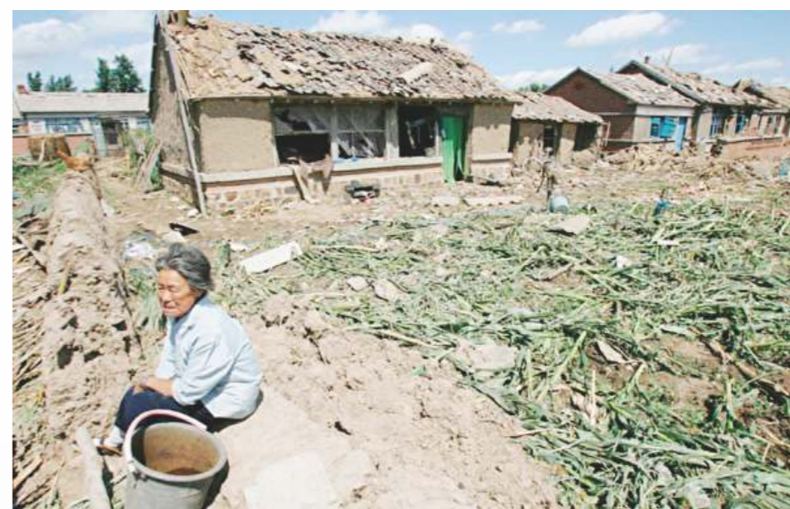
1976年的中國農村人口佔82.6%，大部份是屬於絕對貧困的。