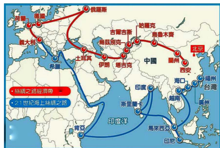
與世界各地國家通過共建“一帶一路”，促進全球的互聯互通，共同構建人類命運共同體。

中國實現貿易與投資規則與世界的對接，並使中國逐漸成為全球產業鏈、價值鏈的組成部分。第三浪潮是從2013年起的主動開放，國家提出共建“一帶一路”，利用自己在資金、某些技術和專業人才的優勢，與世界各地國家通過共建“一帶一路”，促進全球在基礎設施、貿易投資、金融、人文等方面的互聯互通，共同構建人類命運共同體。