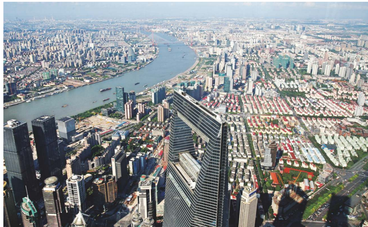
中國於2016年人均GDP達8123.18美元，從40年前排第120多位提升到第60多位。

經過40年改革開放的努力，中國於2016年GDP已達11.2萬億美元，位列世界第二，佔世界GDP比重從1976年的2.2%上升到14.8%；人均GDP達8123.18美元，從40年前排第120多位提升到第60多位。貨貿總額達3.66萬億美元，超過美國位居世界第一；外匯儲備3.01萬億美元，也居世界第一；據德勤《2016年全球製造業競爭力指數》報告，中國製造業競爭力已居世界第一；在世界500種主要工業品中，中國的鋼鐵、煤炭、水泥、電解鋁、精煉銅等220種產品產量都位居全球第一；而中國的高技術產業增加值、出口額等指標都超美國，佔世界首位。