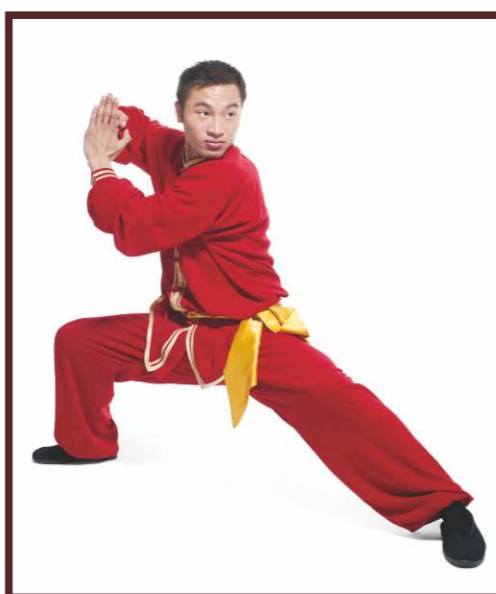
中華武術是分為拳術、器械、對練、對抗性項目、集體項目。