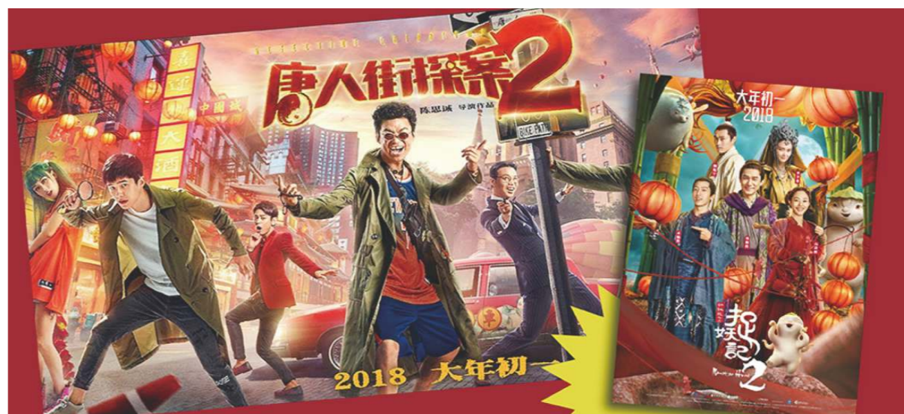
2016年全國居民用於文化娛樂的人均消費支出為800元，比2013年增長38.7%。