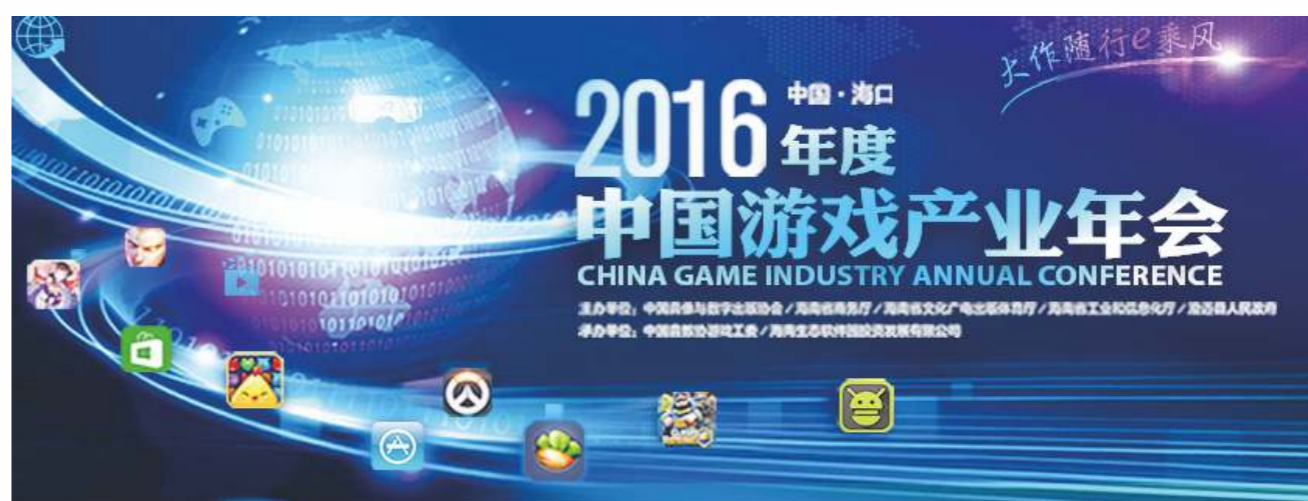
2016年中國遊戲產業達全球體量四分之一，市場規模已超越美國成為全球TOP1。

國內手機線民至2016年12月達6.95億，佔整體線民的95.01%。2016年移動廣告市場達到1750億元，同比增長75%。付費視頻市場規模突破100億，付費使用者7500萬，付費率為14%；美國互聯網視頻付費率53%，中國視頻付費率有上升空間。2016年中國遊戲產業達全球體量1/4位置，市場規模已超越美國成為全球TOP1；報告顯示2017上半年中國遊戲市場實際銷售收入達到997.8億元，同比增長26.7%。