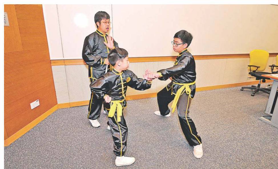
習練武術可鍛鍊身體、培養意志，同時亦是防身、健身之法。

當代中華武術要求動作連貫，快速多變，節奏鮮明，並要求手、眼、步和氣、力、功內外相合。習練武術可鍛鍊身體，培養意志同時，亦是防身之術和健身之法。中國武林自古有「習武先修德」的信條，不少武術流派把武德放在首位。源遠流長的中華武術不但深受國內各族人民熱愛，還逐漸受到世界各地民眾推崇；港產武打明星李小龍，是當代掀起一股中國功夫熱的始祖。