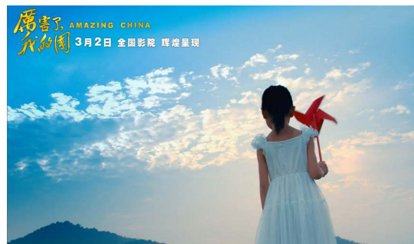
中國夢是中華民族的夢， 也是每個中國人的夢。

中國在人類歷史上曾長期處於世界文明的前列，但在近代工業革命中，中國落伍了；加上西方列強入侵和滿清王朝腐朽，國家逐步淪為半殖民地半封建社會。為了改變民族的命運，一批批仁人志士進行艱辛努力；正當不斷失敗之際，中國共產黨於1921年應運而生，並自覺負起實現中華民族偉大復興的使命，團結各族人民完成民族獨立的任務。新中國成立後，共產黨又帶領人民實現從新民主主義到社會主義的過渡，開始了在社會主義道路上實現中國夢的征程。