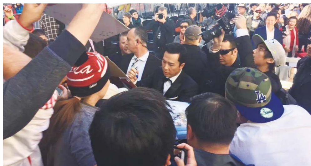
中國電影產業在劇本創作、觀念創新及市場規範等仍有不少發展空間。