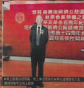
▶早上慈善診所開幕，晚上參加音樂的林東伯伯在現場接受大馬路，致謝也不忘向大馬路。