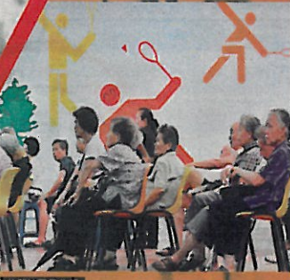
▲長者人口比較多的觀塘翠屏北邨