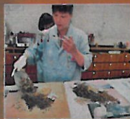
▲診所是由合格中藥師配製藥材配藥。