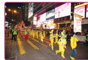
小濟公一起參與尖沙咀「新春國際匯演之夜」人群夾道圍觀