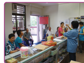
東井園慈善診所贈醫施藥服務受區內坊眾認同

與此同時，東井園林東慈善基金亦帶動各方友好支持濟世利民，工作包括在中山支持「一天一人重見光明」行動和「粉紅力量」兩癌貧困婦女基金、在廣東封開成立東井園林東貧困病者援助金、支持江蘇盱眙愛心雞蛋工程、捐助菲律賓風災災民、在社區舉辦慈善粵劇折子戲、參與「2014國泰航空新春國際匯演之夜」巡遊、賑濟雲南地震災民與及合辦「活力·愛@慶回歸祖國17周年：萬慶粵劇曲藝迎國慶」等。