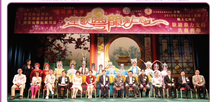
2013年8月19日笙歌粵韻建仁心大會典禮儀式