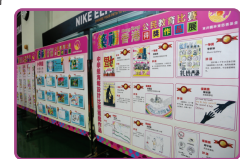
策福香港獲獎學生作品展覽

東井園林東慈善基金先後於2011及2012年聯同東井園佛會在山頂合辦「慈善行·建仁心」步行籌款活動，以籌募慈善診所的開辦支出和營運經費。及後，東井園林東慈善基金與東井園佛會又於2013年8月19日，假新光戲院大劇場舉辦「笙歌粵韻建仁心」粵劇籌款之夜，為贈醫施藥服務籌得過百萬經費。東井園林東慈善診所於2012年在九龍觀塘翠屏北邨翠榆樓126B室開設，為基層家庭和老人提供贈醫施藥；這所慈善診所成立至今已為近3萬人次免費提供中醫藥服務，深受區內街坊和老人的歡迎。